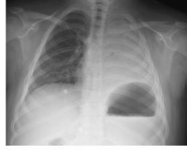
Resim 1) İşlem Önce PAAG