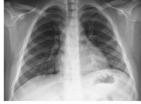
Resim 2) İşlem Sonrası PAAG

Sonuç: Tedaviye yanıt vermeyen tek taraflı atelektazi varlığında, aspirasyon öyküsü bulunmasa ve hasta tipik yaş grubunun dışında olsa dahi yabancı cisim aspirasyonu ayırıcı tanıda mutlaka düşünülmelidir. Yabancı cisimler sıklıkla sağ ana bronшта yerleşmekle birlikte sol bronş tutulumu da görülebilir ve olgular aspirasyon öyküsü olmaksızın sinsi seyredebilir. Bu nedenle dirençli olgularda erken bronkoskopik değerlendirme tanı ve tedavide gecikmeyi önlemede kritik öneme sahiptir.